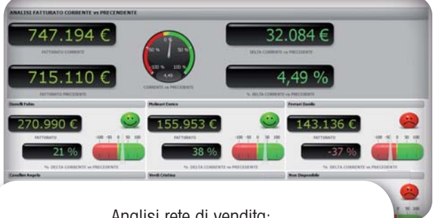
Analisi rete di vendita: fatturato corrente vs precedente