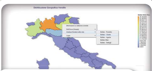
Distribuzione geografica delle vendite